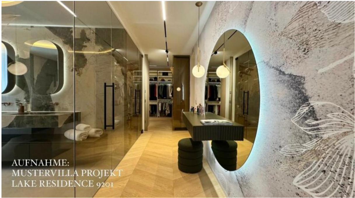
AUFNAHME: MUSTERVILLA PROJEKT LAKE RESIDENCE 9201