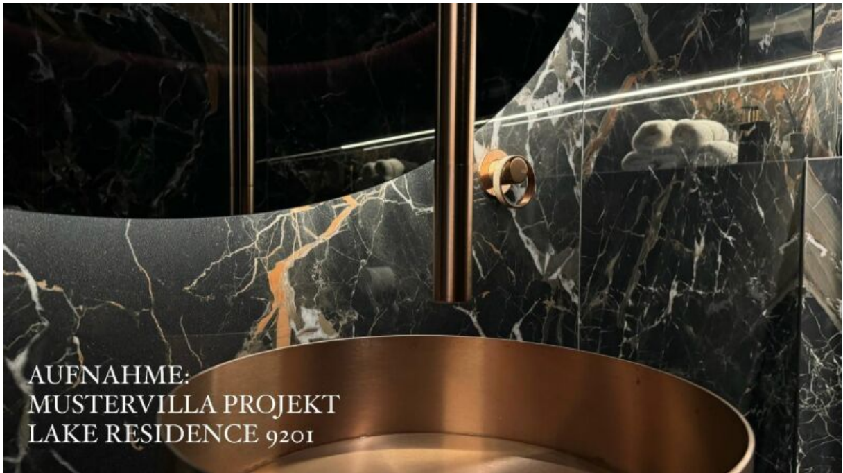
AUFNAHME: MUSTERVILLA PROJEKT LAKE RESIDENCE 9201